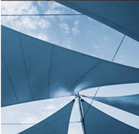
Systemy na ochranu pred slnkom